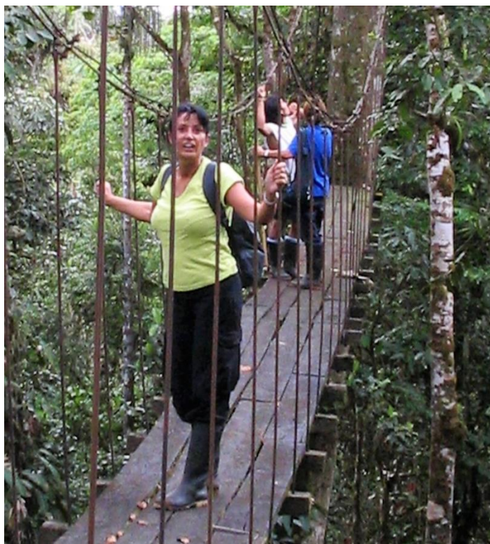
Hangbrug symboliseert het avontuur van de ontmoeting. Je kunt heen en terug.

Ons kerkgebouw staat midden in het centrum van Barendrecht. Wij zien het als onze opdracht om er te zijn voor mensen buiten onze gemeenschap, met name onze medemensen in nood. Een kerk waar leren en openstaan voor nieuwe dingen hand in hand gaan met praktisch je handen uit de mouwen steken.