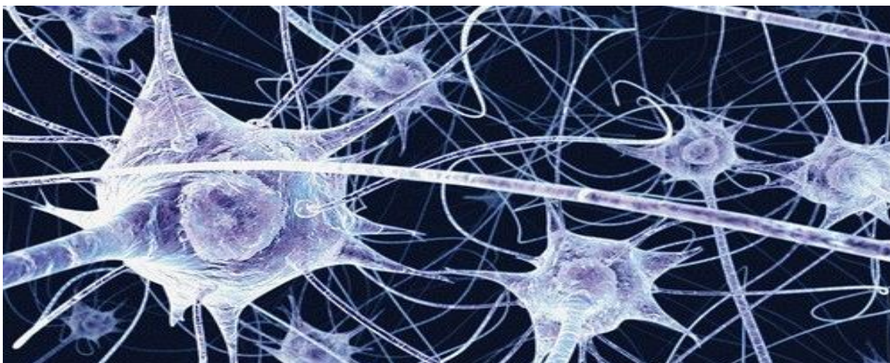
Afzonderlijke cellen, die met elkaar verbonden zijn

Wij zijn een hechte gemeenschap waarbinnen een sfeer heerst van warmte en vertrouwen, zowel binnen als buiten de kerkelijke muren. Wij hebben oog voor elkaar zodat niemand zich verloren voelt. Wij zijn er voor elkaar bij vieringen en jubilea en in situaties van ziekte, zorg, eenzaamheid en rouw. Gasten en nieuwkomers onthalen wij gastvrij.